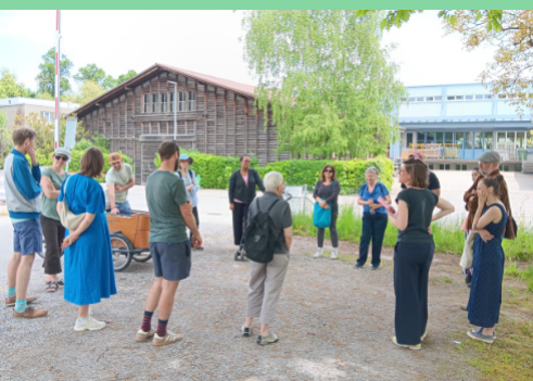
Rundgang Weyer West.

Unter dem Motto «Grüne Kunst» fand zusammen mit dem Kindertreff Jojo und der Farbhöhli ein Kunstmittag für Kinder statt. Eine engagierte Quartiergruppe organisierte einen Pflanzenmarkt und ein Grillfest auf dem Industriegelände. Schliesslich führte der ansässige Quartierverein die breite Bevölkerung an verschiedene Standorte im Quartier und informierte sie zur bevorstehenden Arealentwicklung Weyermannshaus West.