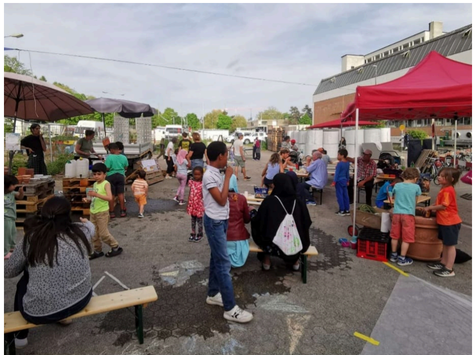
Grillfest im Alten Loeblager.

Um den spannenden Ort für die breite Quartierbevölkerung zugänglich zu machen, organisierte die Quartierarbeit Untermatt zusammen mit zahlreichen Akteuren aus dem Quartier ein attraktives Rahmenprogramm.