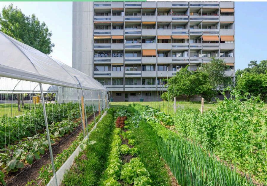
Zwischen Hoch- und Scheibenhäuser entstand im Tscharnergut ein grosser Gemeinschaftsgarten.

Seither wird jeden Samstag mitten im Tscharnergut gegärtnert. Alle die Lust haben arbeiten mit. Die Ernte wird jeweils am Ende des Arbeitstages unter den Mitwirkenden verteilt. Dabei wird grosser Wert auf die lokalen Ressourcen und die Umwelt gelegt: der Mist vom Tiergarten nebenan dient als Dünger, in der Werkstatt vom Quartierzentrum entstand die grosse Materialkiste, Tonnen sammeln das Regenwasser vom Hochhaus, der benachbarte Kindertreff bewirtschaftet ein Aussenbeet und zum Decken von laufenden Kosten wird künftig punktuell Bio-Gemüse an das Café im Quartierzentrum für das Zubereiten der Mittagessen verkauft.