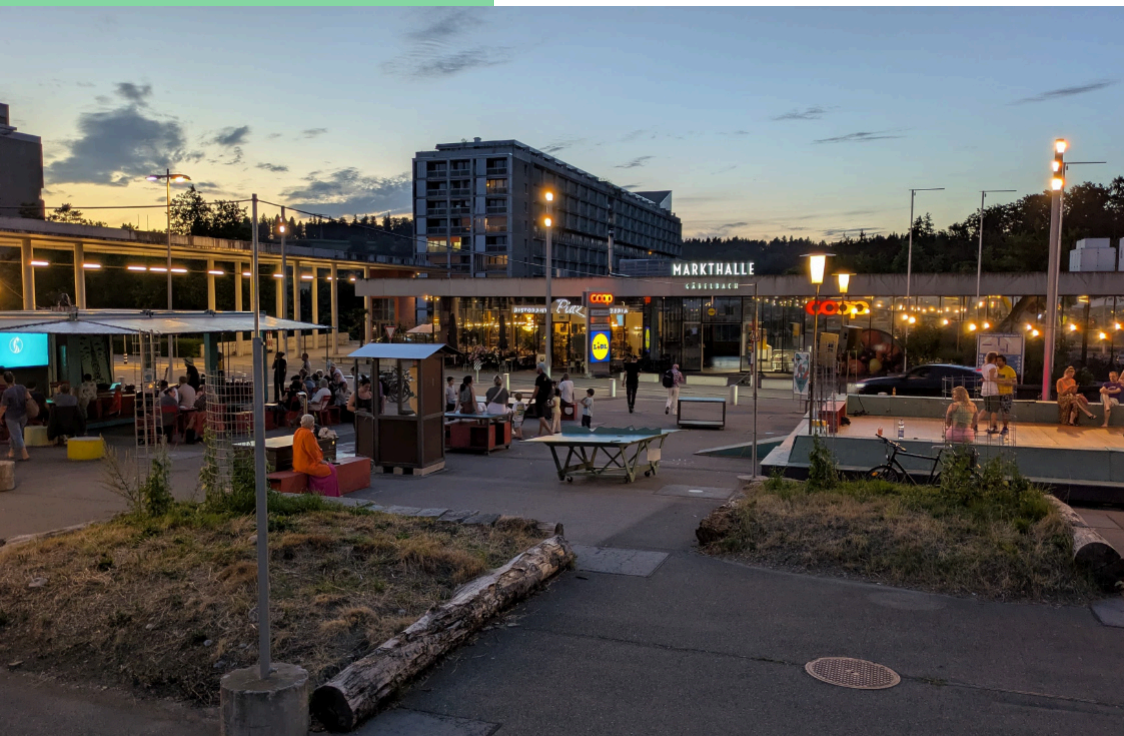
Abendstimmung auf dem Ansermetplatz.