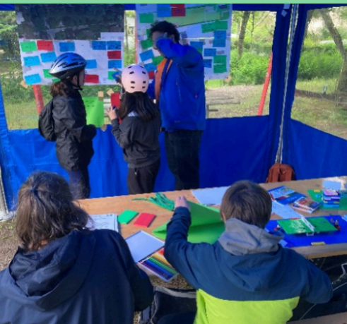
Mitwirkungsanlass in der Schlossmatt.

Im Frühling 2025 startete dazu gemeinsam mit Dok Impuls und QM3 ein Mitwirkungsprozess. Am ersten Mitwirkungsanlass im Mai 2025 sowie über eine Online-Befragung konnte die Quartierbevölkerung ihre Bedürfnisse mitteilen. Kinder, Jugendliche und Erwachsene beteiligten sich engagiert. Die Rückmeldungen zeigen deutlich: der Spielplatz ist ein geschätzter Ort, aber mit spürbarem Verbesserungspotential. Gewünscht ist ein Platz, der mehr bietet – mehr Natur, mehr Bewegung, mehr Begegnung, aber auch mehr Struktur und Sicherheit. Mehrfach gewünscht wurden Wasser- und Sandelemente oder Klettermöglichkeiten für ältere Kinder.